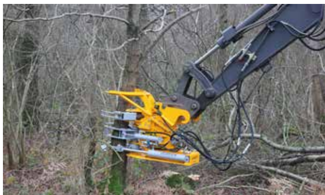
KS650 nyolcadolt CW10 csatlakozóval és gyűjtőmarkolóva

A Herdernek két modellje van a programban: KS650 és KS860. A KS650 olyan kotrógépekhez illik, melyeknek az öntömege 8-18 tonna. Mindkét modellt nagy rönkátmérők vágásához tervezték. A KS650 könnyedén dönt rönköket 20 cm rönkátmérőig, a KS860 pedig 30 cm rönkátmérőig. Keményfánál ez valamennyivel kevesebb. A KS860 egy gyorsmenet kapcsolóval rendelkezik, ezzel egy magasabb munkavégzési sebességet hoz létre a nagy munkahenger ellenére. A gyorsmenet kapcsoló gondoskodik arról, hogy a kés és a markoló karok gyorsabban záródjanak, amint ellenállásba ütköznek.