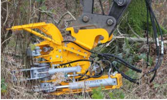
A gyűjtő markoló 1 lépése

A döntőfej opcionálisan egy gyűjtő markolóval szerelhető fel. Ez valamennyi modellnél alkalmazható. A gyűjtő markoló arról gondoskodik, hogy több ág darabról-darabra elvágható és összegyűjthető legyen, mielőtt azokat elfektetné. A gyűjtő markoló ezzel lecsökkenti a kotrógép lengőmozgás mennyiségét, amelytől az ágak egyszeri vágásánál vagy kisebb fák vágásánál sok időt nyerhetünk.