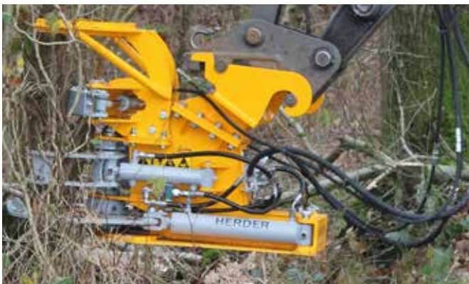
A gyűjtő markoló 3 lépése

A vágásnál a két „súlyos” markoló kar felel azért, hogy az ág erősen megszoruljon. Ha a következő ág vágásra kerülhet, akkor markoló karoknak ki kell nyílniuk. Azzal, hogy a levágott anyag ne essen ki, a gyűjtő markolónak csukott állapotban kell lennie. Így kerül az elvágott anyag rögzítésre, hogy a markoló karok a következő ág vágásakor nyithatóvá váljanak.