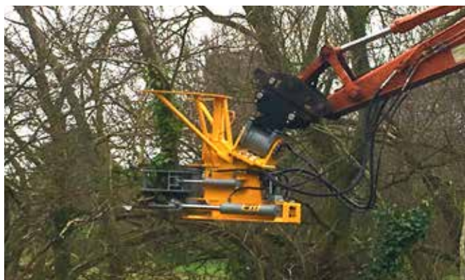
KS860 billenő funkcióval

Ha a döntőfejet gyakran gallyazásra is használnák, ez a funkció hasznos. A billenő mechanizmust helyezük a döntőfej és a kotró felfogatás közé, a billentés 100 °-ban elfordulhat, ebből 50 ° balra és 50 ° jobbra. A billenő funkció a kotrógép kanálmozgató hidraulikájára van kötve.