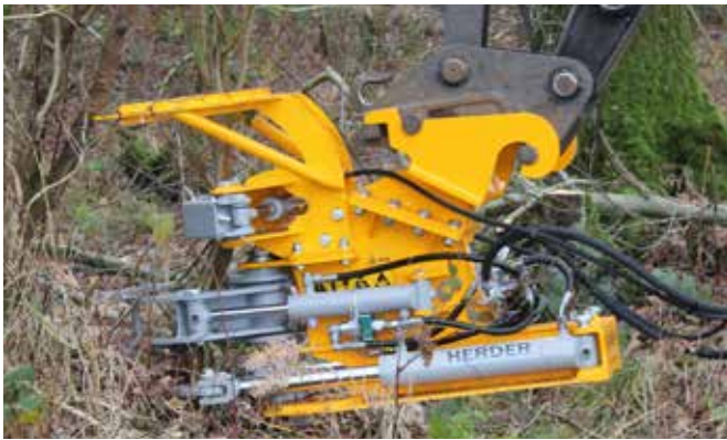
A gyűjtő markoló 2 lépése

A döntőfej opcionálisan egy gyűjtő markolóval szerelhető fel. Ez valamennyi modellnél alkalmazható. A gyűjtő markoló arról gondoskodik, hogy több ág darabról-darabra elvágható és összegyűjthető legyen, mielőtt azokat elfektetné. A gyűjtő markoló ezzel lecsökkenti a kotrógép lengőmozgás mennyiségét, amelytől az ágak egyszeri vágásánál vagy kisebb fák vágásánál sok időt nyerhetünk.